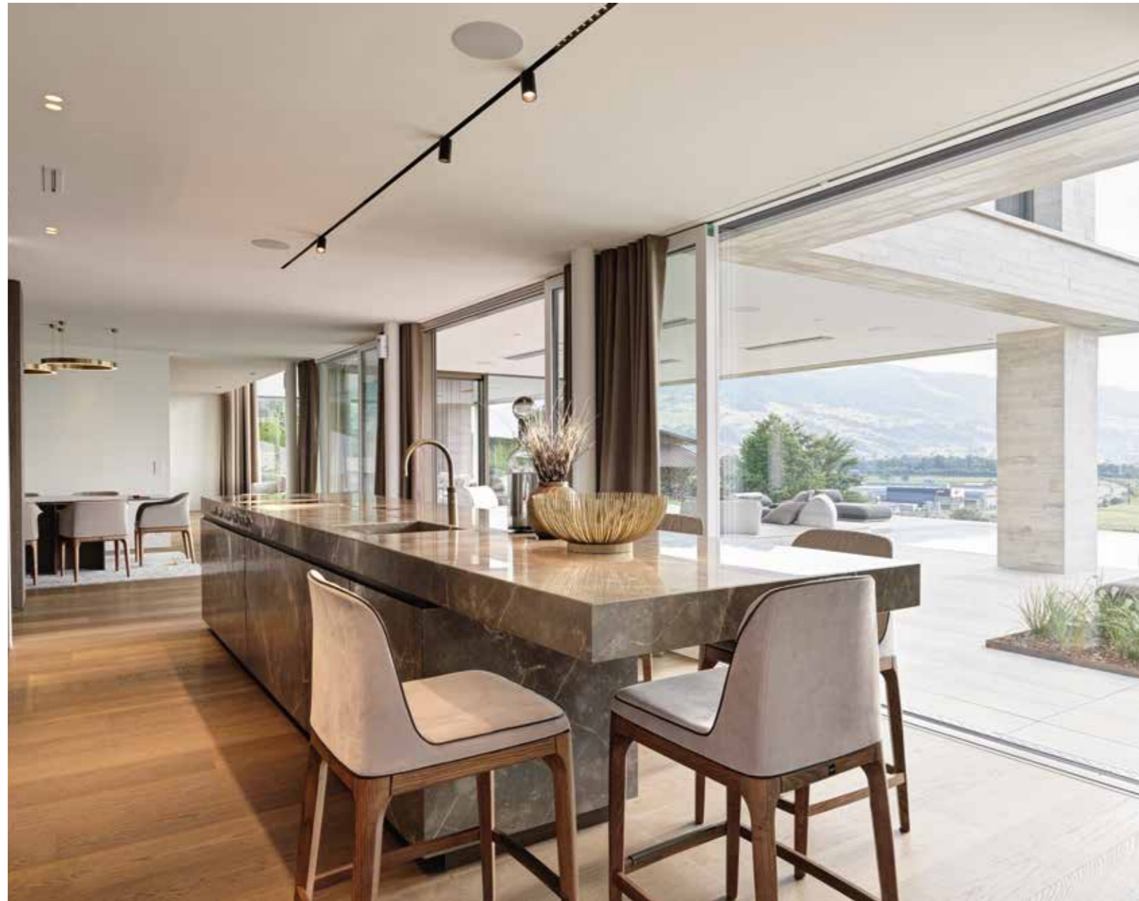
Imposant Ob von der Küche oder vom Esstisch aus: Das Panorama ist omnipräsent.

Das Wasser im Pool plätschert beruhigend, die Abendsonne wärmt die nackten Beine, der kühle Weisswein mundet köstlich: Das ist Entspannung pur. Die gepolsterten Liegen laden zum Ausspannen ein, während die Gedanken verträumt davonschweben und die Blicke bis über den Zürichsee schweifen. Hier lässt es sich leben, hier fühlt man sich im Lot. Hier bezeichnet in diesem Fall eine repräsentative Villa der Extraklasse. Die Lage, das grosszügige Raumangebot und der stilvolle Innenausbau aus erlesenen Materialien überzeugen und zeigen, was Luxus sein kann: sich abzuheben vom Üblichen, sich dem Zelebrieren vom Exklusiven hinzugeben, sich nur mit dem Besten zufriedenzugeben. Das Architekturbüro SimmenGroup hat