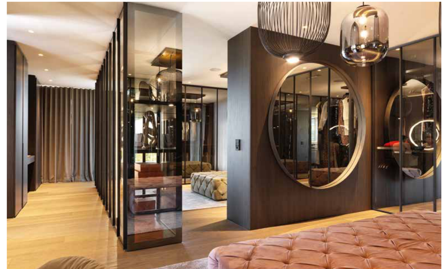
Grosszügig Raumhohe Regale und Schränke mit Stauraum im Überfluss: die beiden Ankleidebereiche.